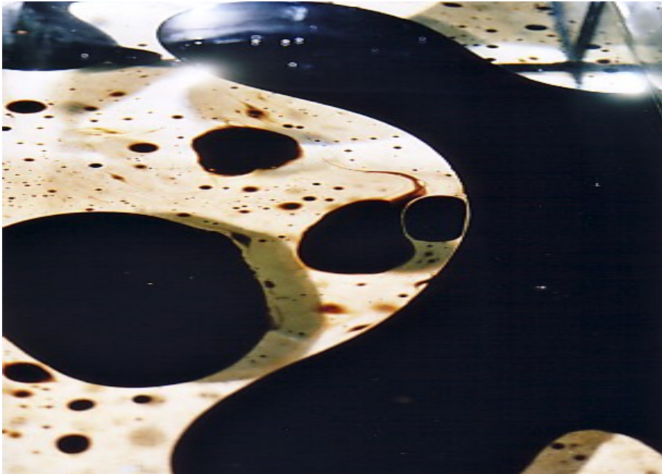
Abb. 2: Versuchsphase 1: Ölkontamination Das Rohöl wird auf die Wasseroberfläche aufgebracht.