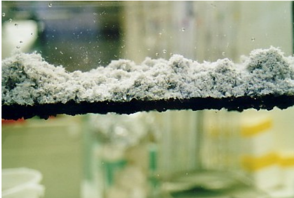
Abb. 4: Versuchsphase 3: Öladsorption durch das Ledergranulat Das Rohöl wird zu 100% vom Ledergranulat durch Adsorption aufgenommen. Keine Flockensedimentation. Das Granulat bleibt als Teppich auf der Wasseroberfläche.