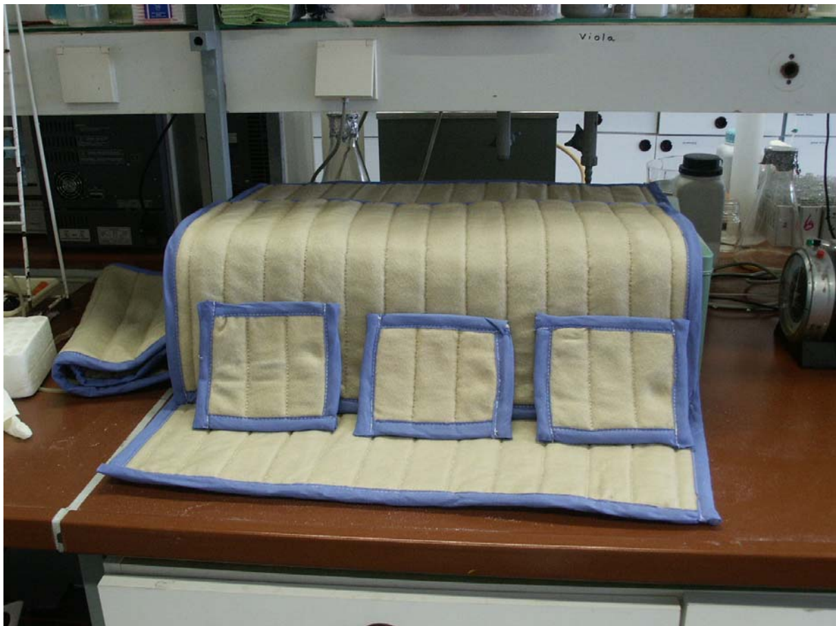
Abb. 1: Prototypen einer Ölbindematte aus Polypropylenvlies, gefüllt mit X – Oil®