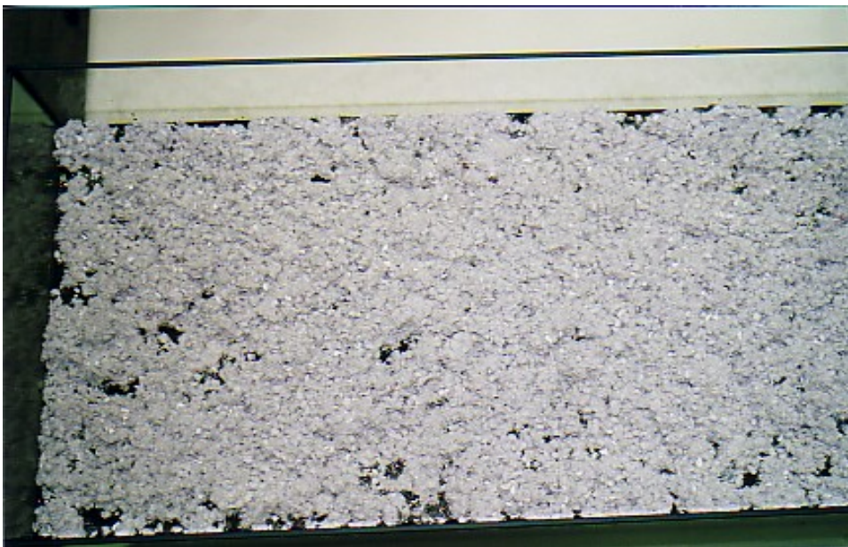
Abb. 3: Versuchsphase 2: Einbringung des Ölbinders Eine definierte Ledergranulatmenge wird gleichmäßig verteilt. (Einwirkzeit: 15 min. ohne Einrühren).